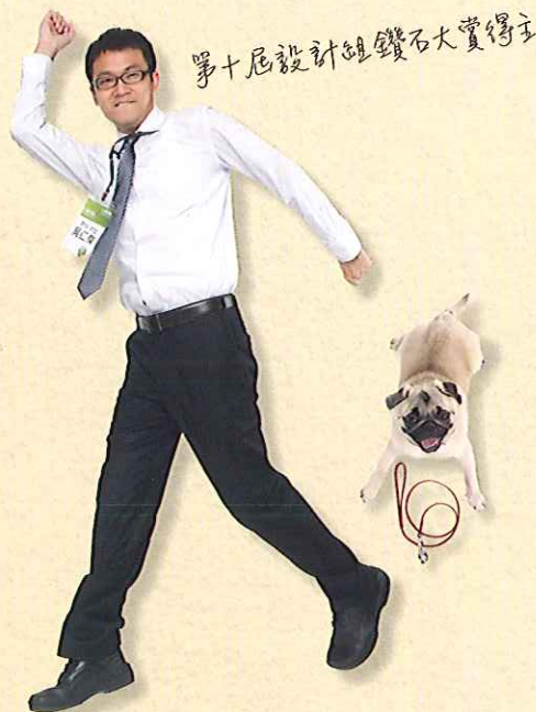
第十屆設計組鑽石大賞得主